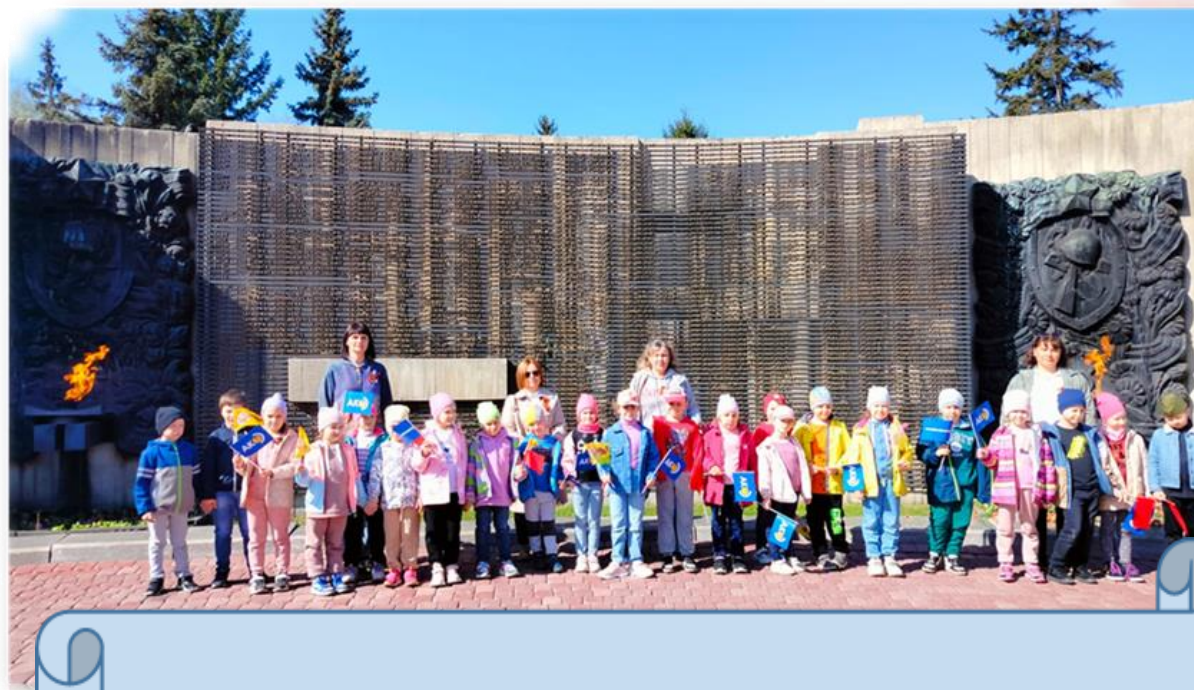
Экскурсия к Мемориалу Славы