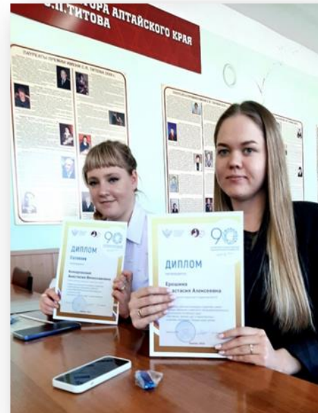
Краевой конкурс «Наставник: мастер, друг и вдохновитель»