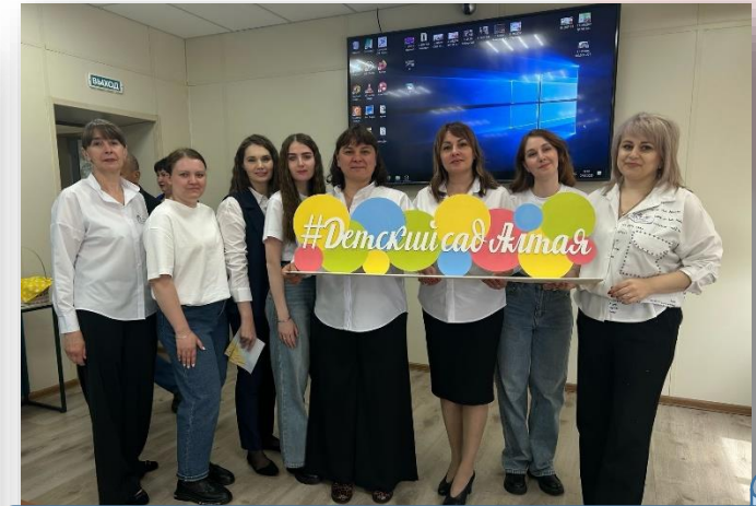
Краевой конкурс «Детский сад Алтай»