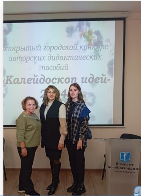
Городской конкурс «Калейдоскоп идей»