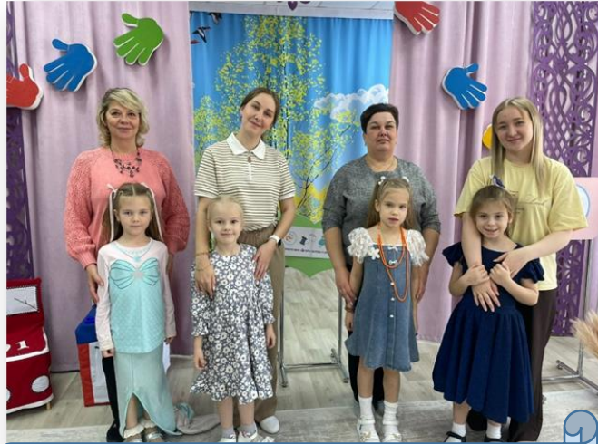
Конкурс ДОО «Юный мастер»