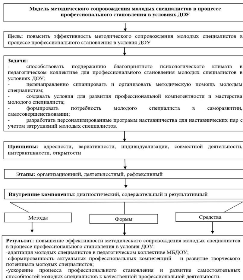
Рисунок 5. Модель методического сопровождения молодых специалистов в процессе профессионального становления в условиях ДОУ